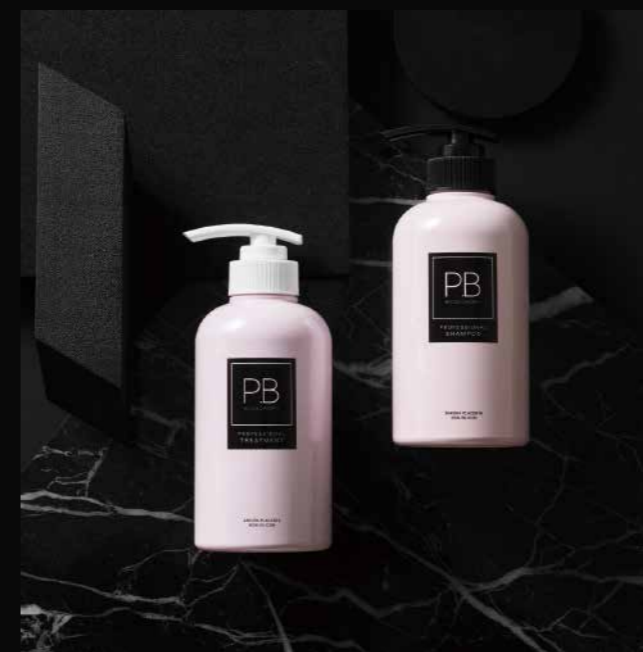
PROFESSIONAL TREATMENT 400g

桜プラセンタを配合した初めてのシャンプーとトリートメント。 髪本来の美しさへ導くために、髪の主成分である18種類のアミノ酸と3種類のケラチン、 自然の恵が豊富な16種類のボタニカル成分も配合。日本固有の京都「山桜」の胎座(植物プラセンタ)や 希少なカシミアヤギから採取したケラチンを配合することで髪と頭皮に栄養を与え、健康的な美髪へ。