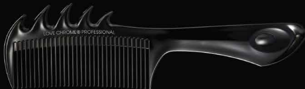
B3 NAMI DEEP BLACK