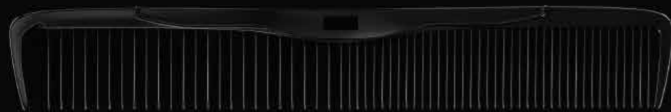
B3 SUS STANDARD CUT COMB DEEP BLACK B3 交換用替刃 / SPARE BLADE