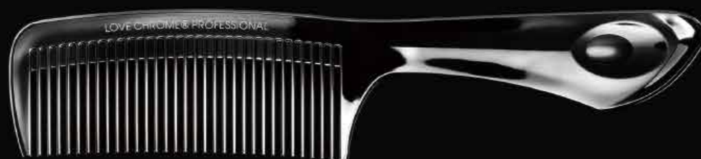
B3 TETSUKI DEEP BLACK