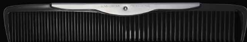
B3 SUS STANDARD CUT COMB DEEP BLACK

The new DEEP BLACK color has a special coating made with minerals to enhance heat resistance and durability. It has a thicker coating compared to the regular model, giving it a deep, shiny black color.