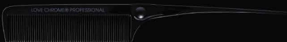
B3 SUS STANDARD RING COMB DEEP BLACK